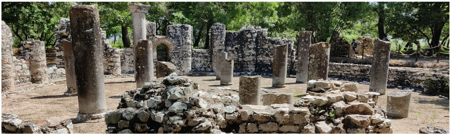
Butrint: Baptisterium mit dem berühmten Mosaikboden