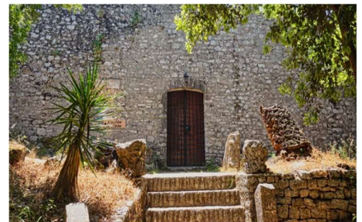
Dreieckige venezianische Burg