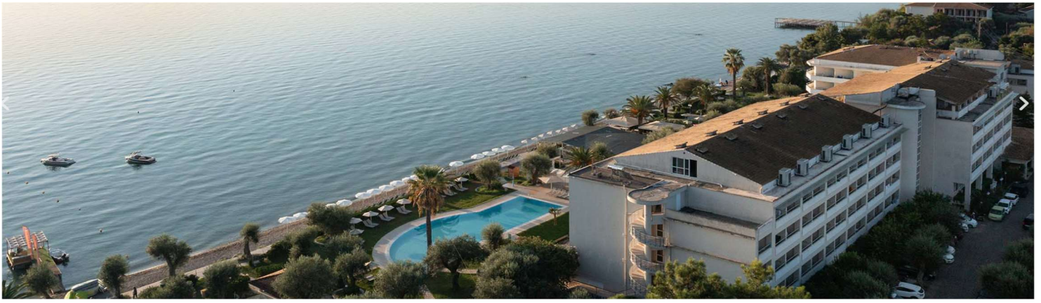
Unser Hotel —